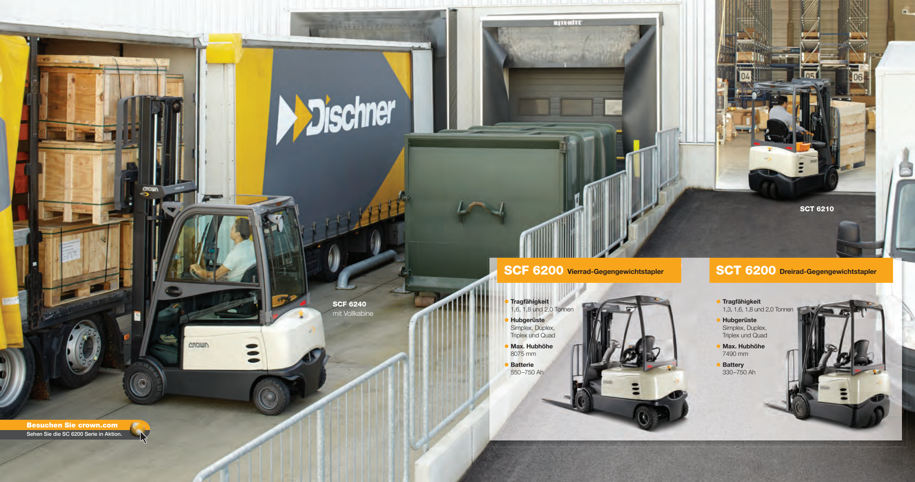
SCF 6240 mit Vollkabine

deutliche Vorteile in Sachen Stabilität und Manövrierfähigkeit. Mit Optionen für Bedienelemente, Leuchten, Zubehör und mehr lässt sich der Stapler noch weiter für Ihren Einsatzbereich optimieren.