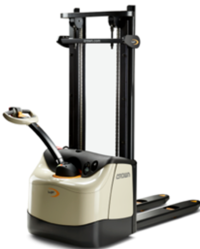
WF 3200 Serie 1000 – 1200 kg