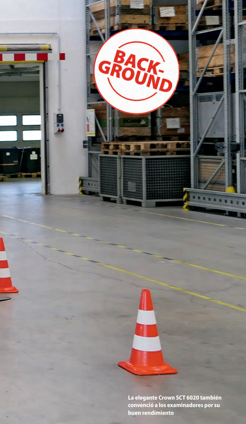
La elegante Crown SCT 6020 también convenció a los examinadores por su buen rendimiento

Los fundadores de Crown, Carl H. y Allen A. Dicke asumieron como estandarte propio el lema «Diseño para las personas» cuando iniciaron la producción de apiladoras en 1957. Esta empresa familiar de New Bremen, en el estado federal de Ohio, EE. UU., comparte junto a un competidor el cuarto puesto de la clasificación de principales fabricantes de apiladoras por volumen de ventas. Sin embargo, los más de 100 galardones al diseño que ha recibido Crown marcan la diferencia.