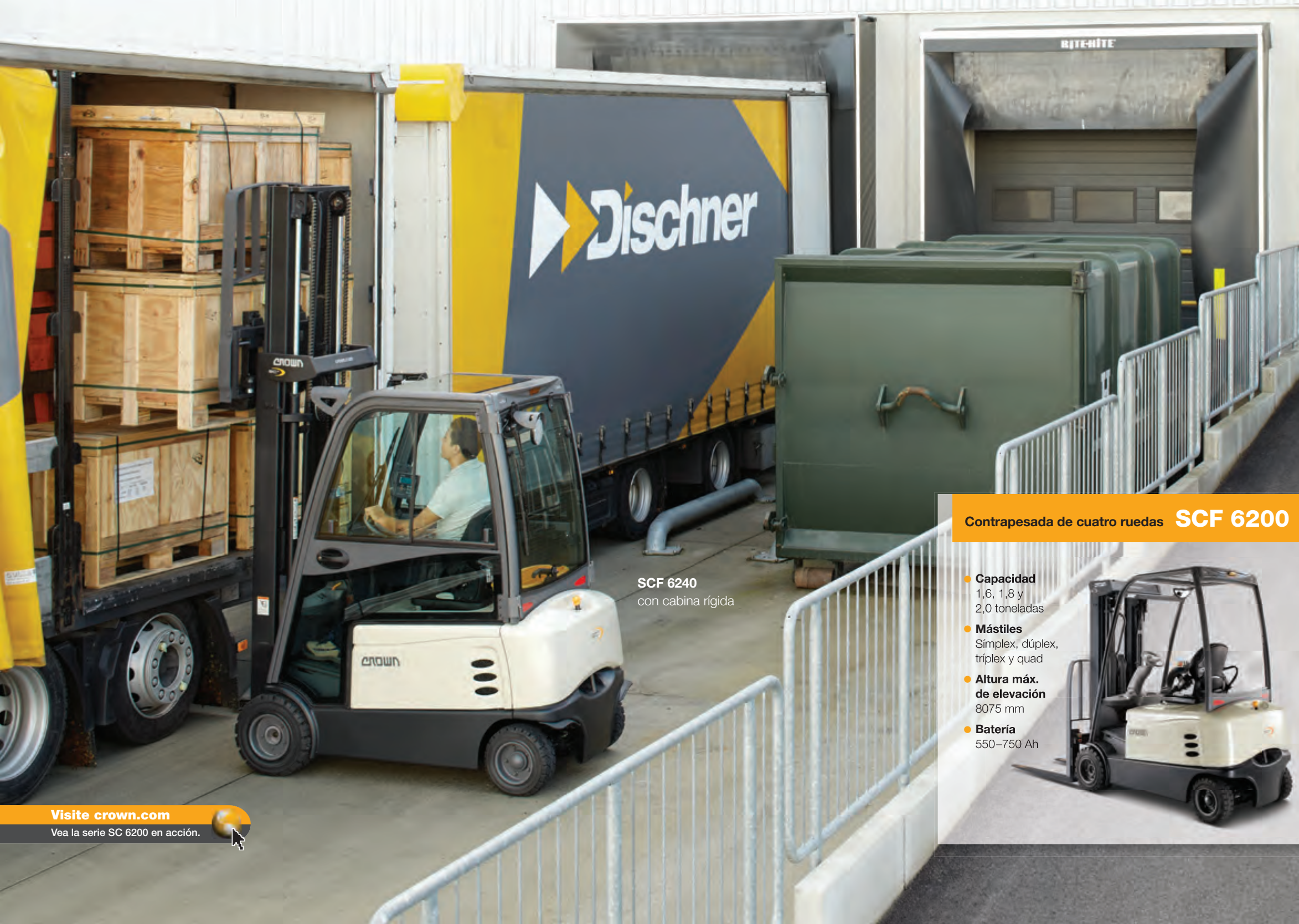
SCF 6240 con cabina rígida

cada una de ellas con sus propias características de estabilidad y maniobrabilidad. Si lo desea, puede personalizar aún más su carretilla con múltiples opciones de controles hidráulicos, luces, accesorios, etcétera.