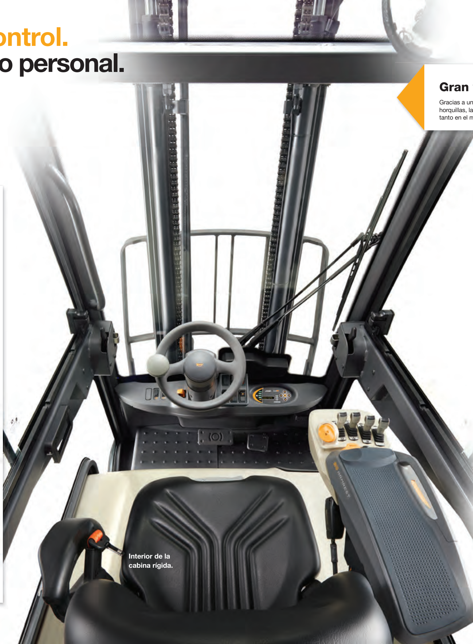
Interior de la cabina rígida.