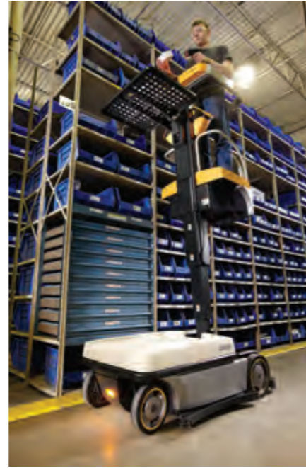
Distribution/Prélèvement de petites pièces