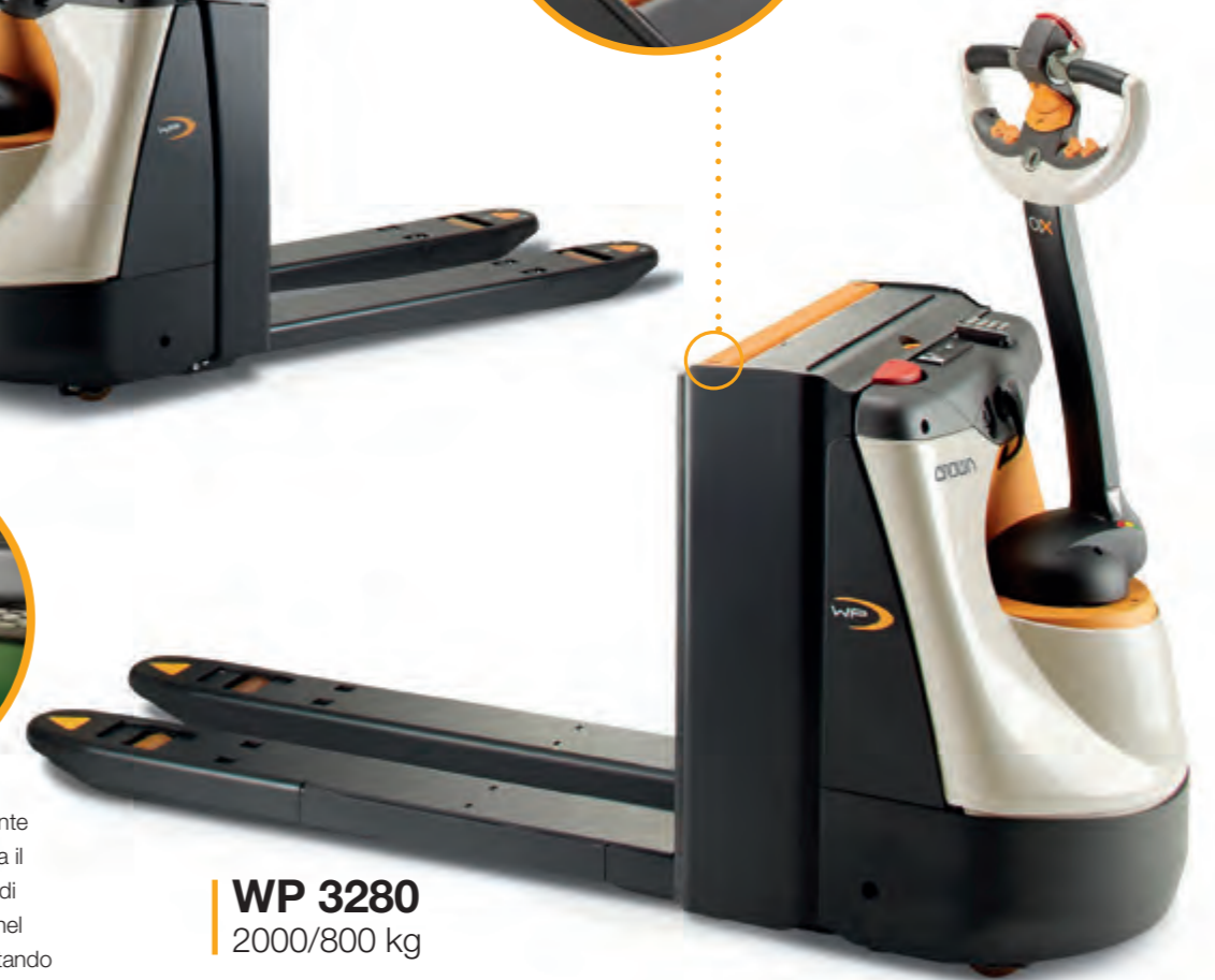
WP 3280 2000/800 kg

Il pulsante di sollevamento dislocato sulla copertura della batteria del WP 3280 fornisce un comodo accesso stando in piedi accanto al carico.