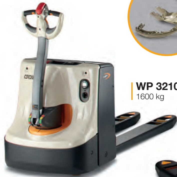
WP 3210 1600 kg

Il robusto timone X10® è realizzato con una lega di alluminio con processo di pressofusione sottovuoto, per una forza e resistenza eccezionali.