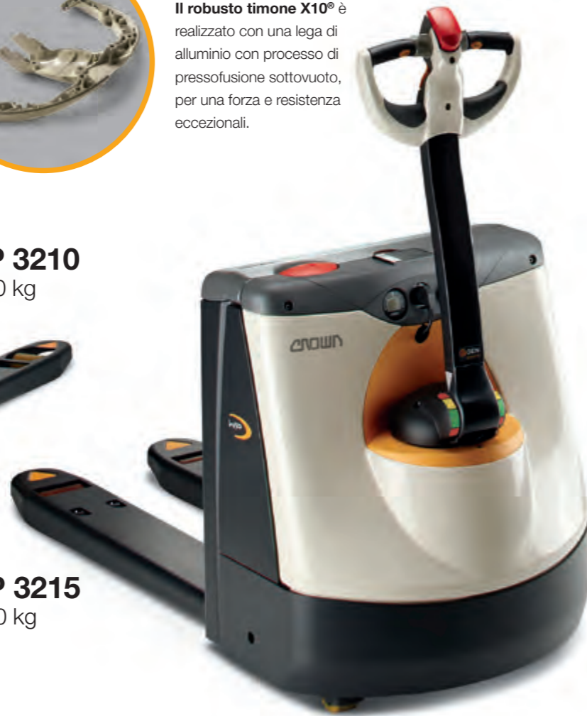
WP 3215 1600 kg