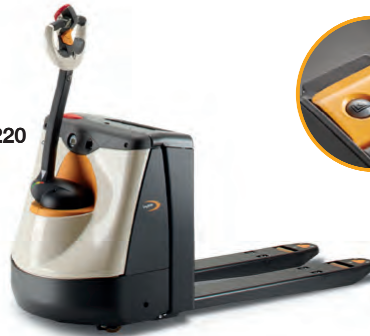
WP 3220 2000 kg

Il sistema di gestione del parco carrelli InfoLink® di Crown offre accesso online a dati vitali su operatori e carrelli.