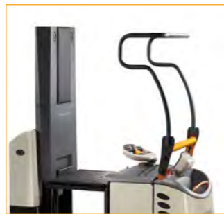
Heffend platform en bestuurderbescherming (GPC 3040/3060)