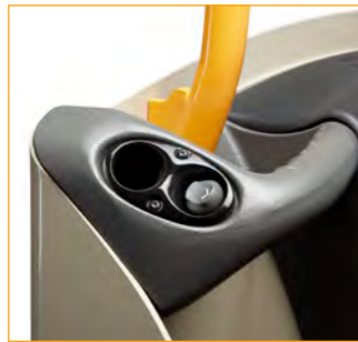
Pick Position Control