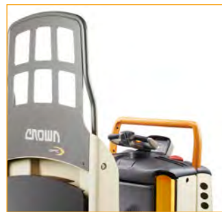
Vast laststeunrek (GPC 3020/3050)