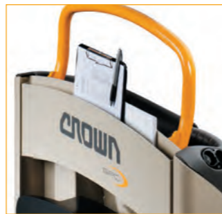
Extra opbergvak achter (GPC 3040/3060)