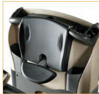
Verstelbare leunstoel (GPC 3040/3060)