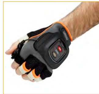
QuickPick Remote orderpicking technologie