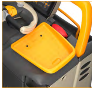
Universeel magnetisch opbergbakje