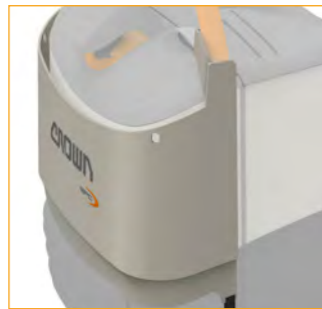
Extra 8 mm dikke robuuste stalen bumper (GPC 3055)