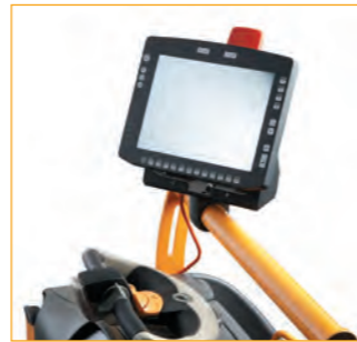
Frame voor Work Assist-accessories voorop