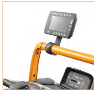
Frame voor Work Assist-accessoires voorop met kabelmanagement