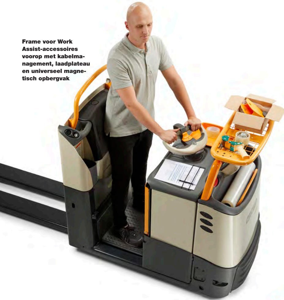
Frame voor Work Assist-accessoires voorop met kabelmanagement, laadplateau en universeel magnetisch opbergvak

Een brede selectie aan Work Assist-accessoires draagt bij aan de uitzonderlijke prestatie- en productiviteitsvoordelen van de GPC 3000 Serie. Crown heeft na analyse van het brede scala aan orderpicking-taken Work Assist-accessoires ontworpen die op de toepassing kunnen worden afgestemd om zo het gebruiksgemak, het comfort, de veiligheid en de productiviteit te verhogen.