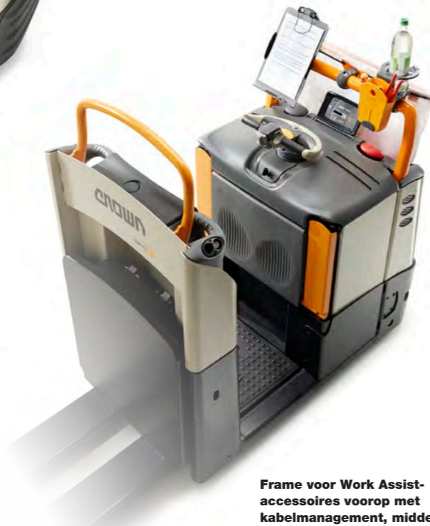
Frame voor Work Assist-accessoires voorop met kabelmanagement, middelgroot klembord, vuilniszakhouder, bekerhouder en opbergzak