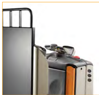
Laststeunrek (GPC 3040/3060)