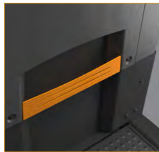
In het midden geplaatst opbergbakje