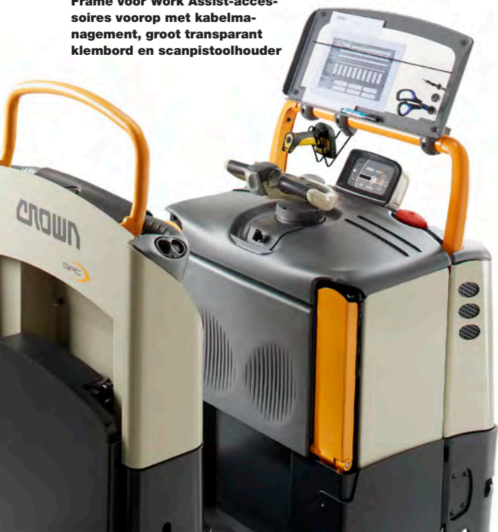
Frame voor Work Assist-accessoires voorop met kabelmanagement, groot transparant klembord en scanpistoolhouder

Een brede selectie aan Work Assist-accessoires draagt bij aan de uitzonderlijke prestatie- en productiviteitsvoordelen van de GPC 3000 Serie. Crown heeft na analyse van het brede scala aan orderpicking-taken Work Assist-accessoires ontworpen die op de toepassing kunnen worden afgestemd om zo het gebruiksgemak, het comfort, de veiligheid en de productiviteit te verhogen.