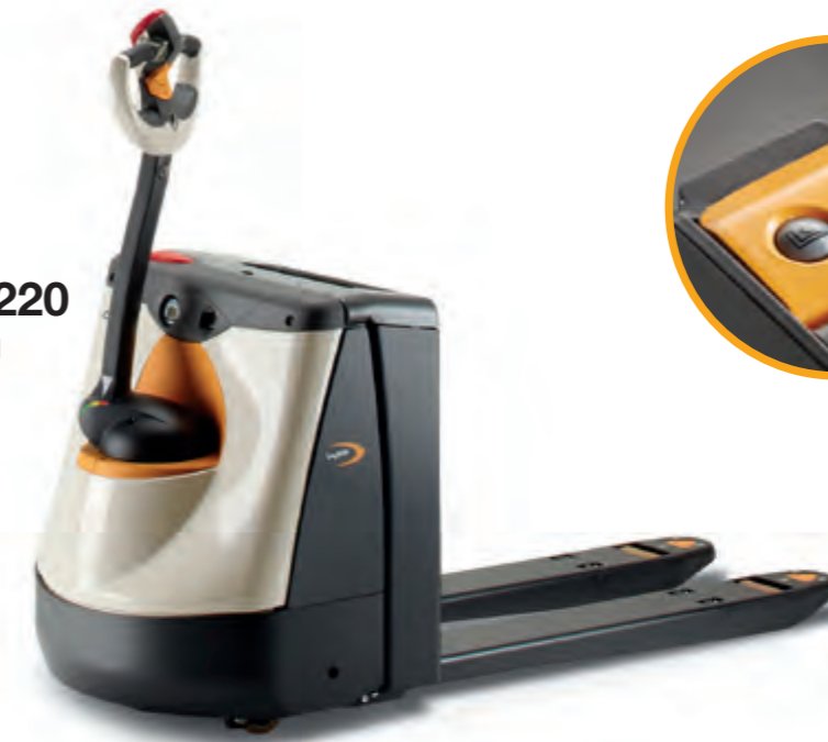
WP 3220 2000 kg