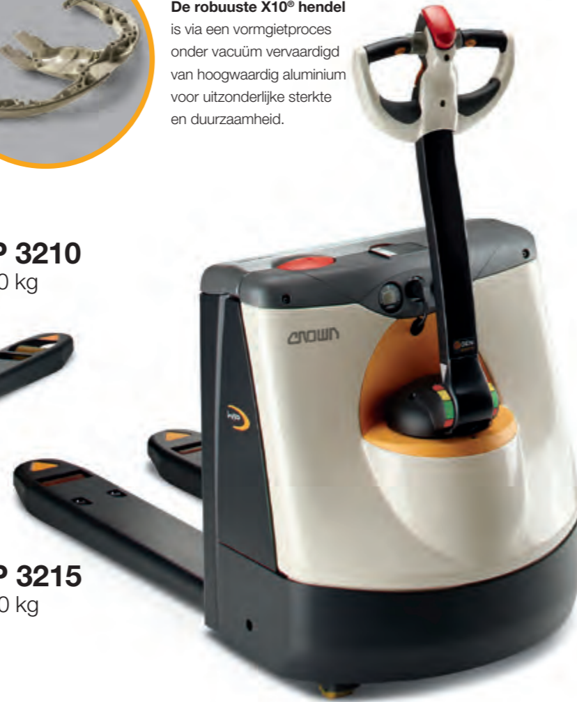
WP 3215 1600 kg