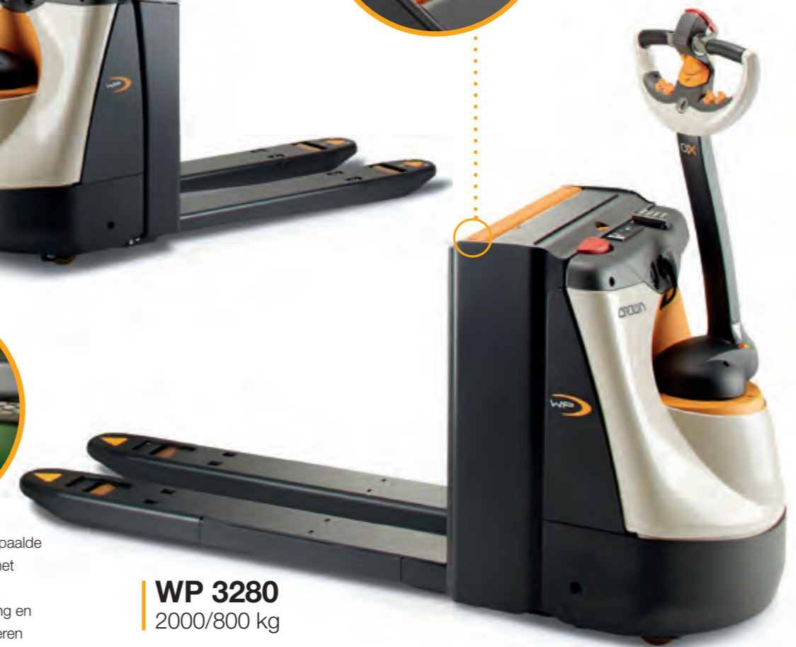
WP 3280 2000/800 kg

De trekstangen (alleen op bepaalde modellen) plaatsen de as van het hefmechanisme op het hoogst mogelijke punt om beschadiging en slijtage bij werken op ruwe vloeren uit te sluiten.